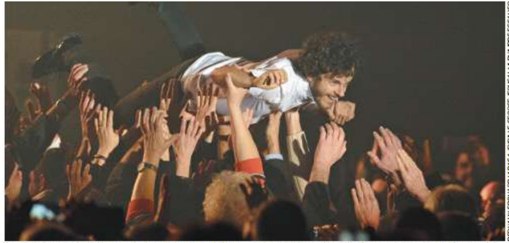
Découvert par l'émission « Graines de star » en 2001, Michaël Gregorio a « ouvert une vraie brèche dans le créneau de l'imitation chantée ».